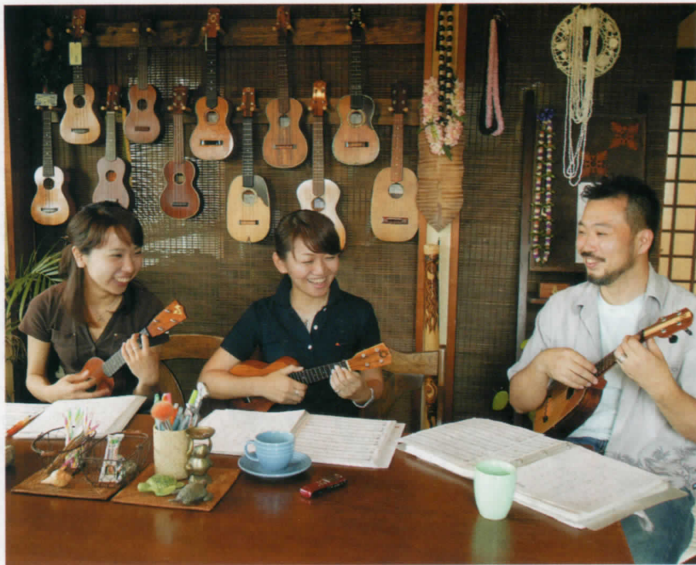
↑高台にあり、海風を感じる教室でのレッスンは和やかムード。窓からの眺めも抜群。

●鎌倉市七里ガ浜1-12-27 2F 体験レッスン3675円(約1時間) 日時を問い合わせのうえ要予約。通常レッスンは毎日レベル別に開講。http://www.ukulelestudio.jp/