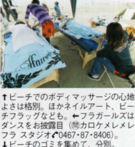
↑ビーチでのボディマッサージの心地よさは格別。ほかネイルアート、ビーチフラッグなども。←フラガールズはダンスをお披露目(同カロケメレメレフラスタジオ☎0467・87・8406)。 ↓ビーチのゴミを集めて、分別。